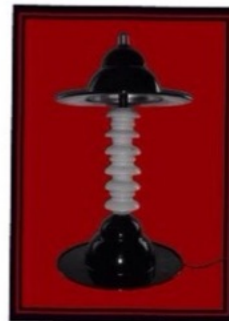
Bianca & Nera

Lampada da Tavolo realizzata con isolatori in ceramica, plafoniere metalliche e un attacco di lampadina