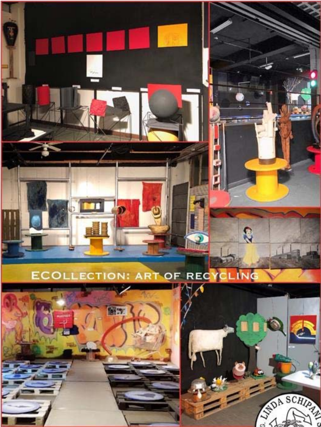
ECOLLECTION: ART OF RECYCLING