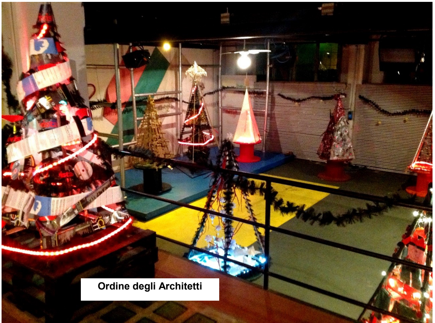
Ordine degli Architetti