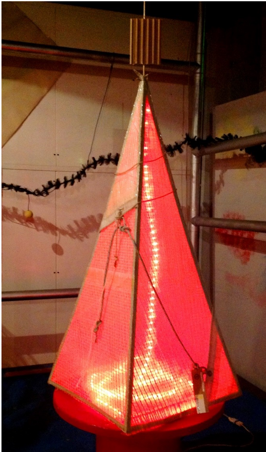
Concetta DePasquale per SunSicily