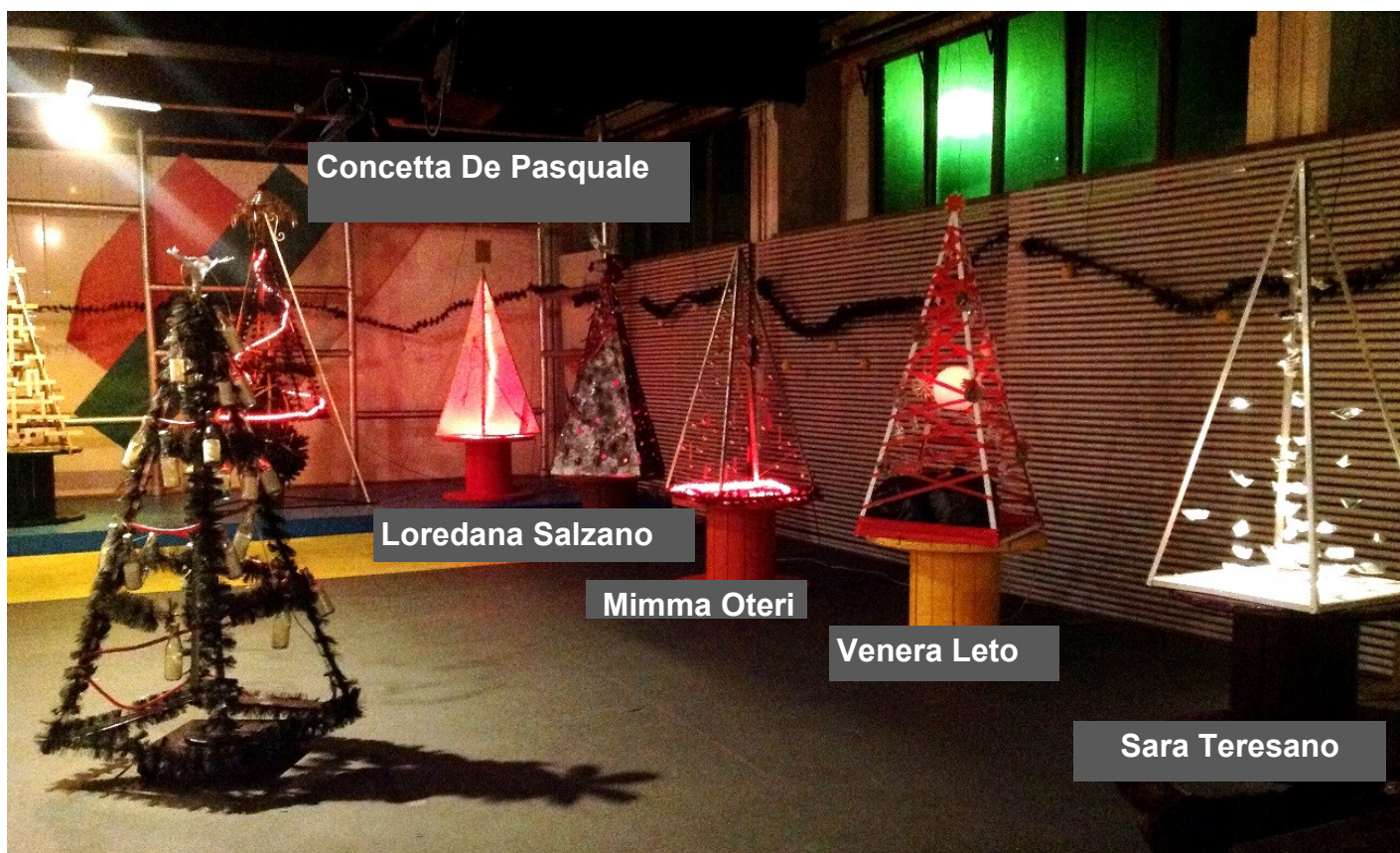
Concetta De Pasquale